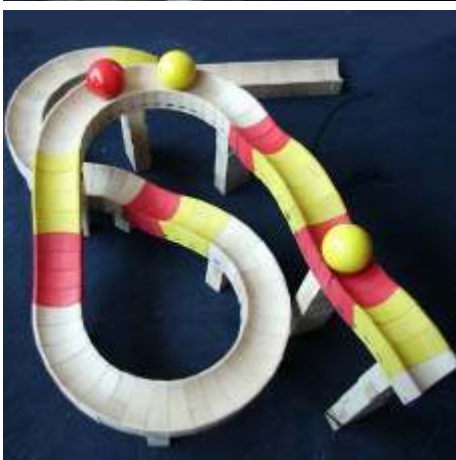
144 Bausteine 4 Kugeln