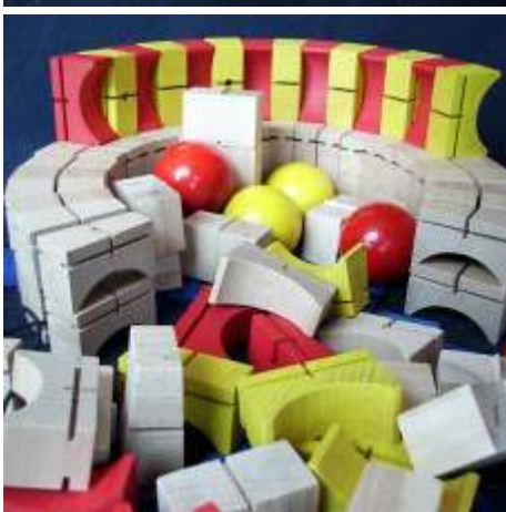
D 6,3 cm